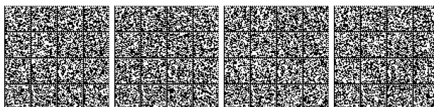
Tabella V4- 4: Parametri progettuali per la rete idranti secondo UNI 10779